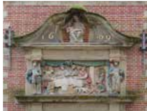
Gevelsteen Lazaruspoortje. Het Lazarus-verhaal staat symbool voor naastenliefde.